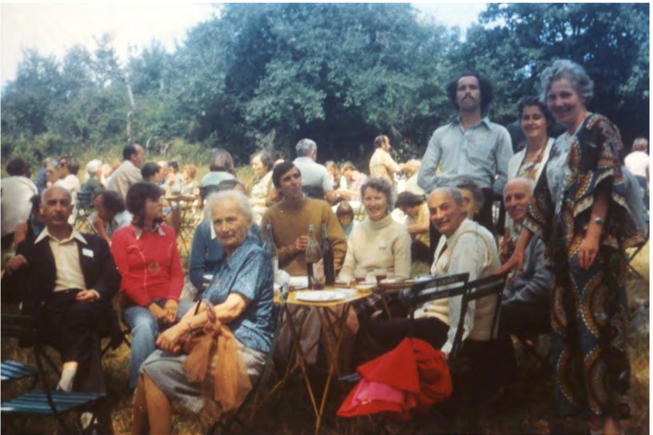
Le déjeuner à La Coudère. De gauche à droite.