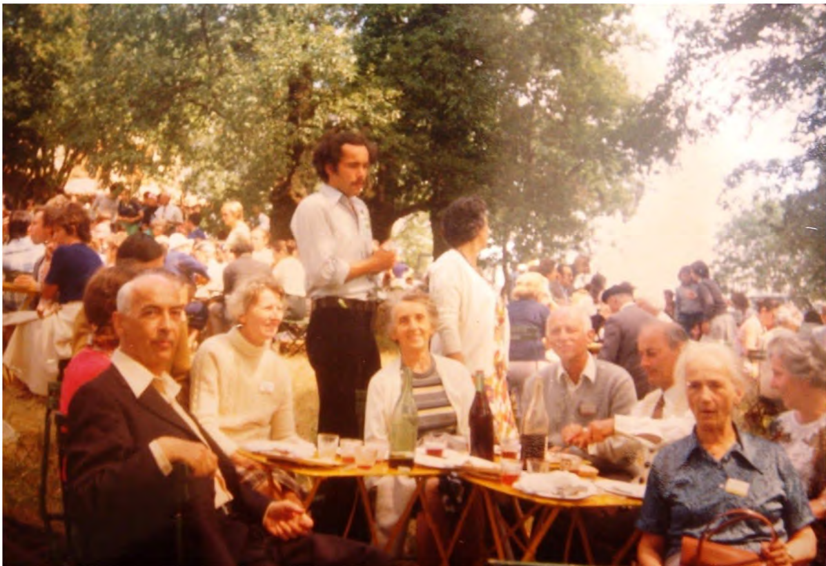
Le déjeuner à La Coudère. De gauche à droite :