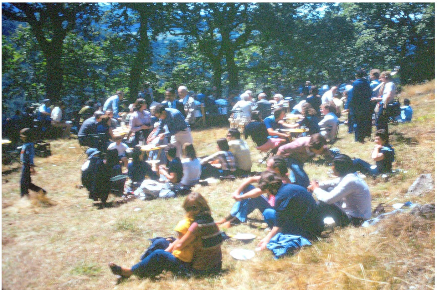
Le déjeuner à La Coudère. Ambiance (ultra sympa)