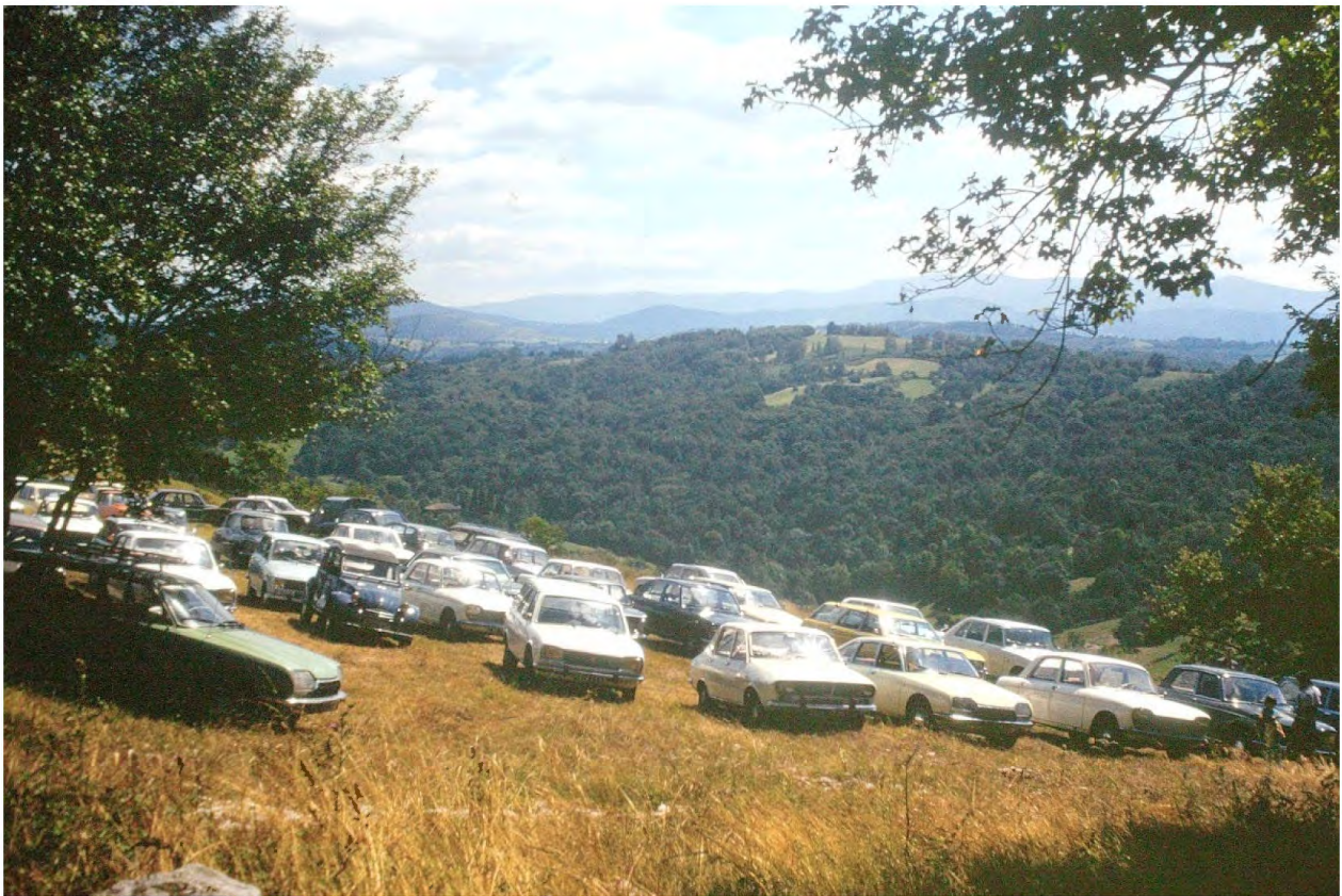
Le déjeuner à La Coudère. Pour les amateurs de voitures vintage...