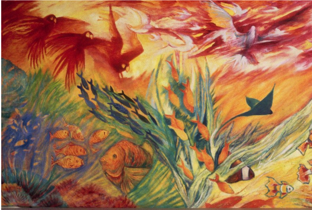
Marylise Reilly-Fajal « The Creation » (extrait)