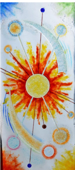
Marc Kniebihler « Composition cosmique » Vitrail, fusing

2011-2024 : Festival International des Arts du Verre - Palau del Vidre (Pyrénées-Orientales)