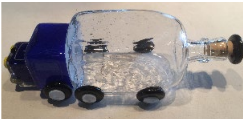
Frédéric Guillot création