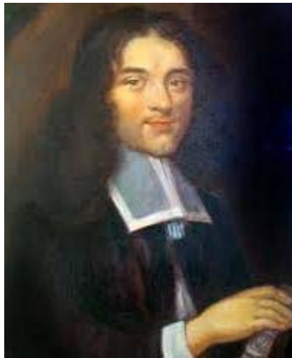
Pierre Bayle par Louis Ferdinand Elle

Publié à Rotterdam en octobre 1696, puis souvent réédité jusqu'au 19ème siècle et lu à l'époque de toute l'Europe cultivée, le Dictionnaire historique et critique de Pierre Bayle est considéré comme le premier grand ouvrage du mouvement philosophique des Lumières. Des pamphlets de Voltaire, ce gros livre a, cinquante ans auparavant, l'érudition, l'alacrité et l'impertinence ; aussi bien Voltaire s'en est-il inspiré au point de le piller sans vergogne. Alors que Descartes préférait se taire, sur la condamnation de Galilée notamment, que Fontenelle cultivait le doute, mais avec modération, ou que Locke abusait de l'argument d'autorité, Pierre Bayle a inventé le persiflage méthodique, ce qui fit de lui le fondateur de la République des lettres, le précurseur du journalisme moderne et l'inventeur de l'exécution par la dérision. Pourtant ce n'était pas un voltairien, mais un protestant, ni un anarchiste, mais un ariégeois. Il est vrai que la tradition du comté de Foix a toujours été de rébellion contre l'autorité établie.