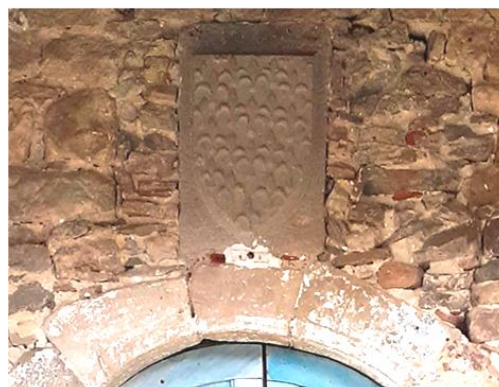
Ecu aux fleurs de lis (porche de l'église de Gabre)

A la fin du XIII e siècle le commandeur, profitant de l'absence du comte Roger-Bernard III qui guerroyait en Aragon, conclut un paréage avec le roi de France Philippe le Hardi, à la suite duquel le territoire fut rattaché à la province de Languedoc et constitua une enclave dans le comté de Foix. Autour de l'église consacrée à Saint Laurent et de la tour de la commanderie qui lui était accolée, le village se développa comme une petite bastide qui prit le nom de La Bastide de Plaisance, avec souvent la précision "en France", car ce n'était désormais plus le comté de Foix comme les localités environnantes mais une partie du royaume de France. De cette époque le porche de l'église garde un témoignage, c'est l'écu orné d'un semis de fleurs de lis, emblème des rois de France avant le XV e siècle où il ne conservera que trois fleurs de lis.