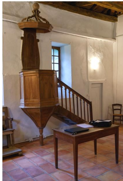
Temple de Gabre- La chère- Photo G. Tavera 2017

Lorsqu'en 1938 l'Eglise réformée de France se reconstitua en rassemblant les diverses branches dispersées, certaines paroisses dont celle du Mas d'Azil préférèrent garder leur spécificité d'Eglises réformées évangéliques, mais ce choix n'empêcha pas les protestants de Gabre, quelle que soit leur dénomination, de se retrouver, l'été venu, dans le temple du village.