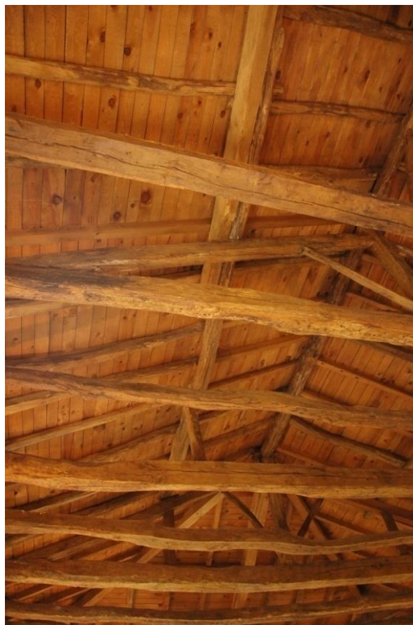
La charpente du temple de Gabre

Dans sa modestie, avec sa charpente rustique qui rappelle la Grange de Wassy, ce temple vieux maintenant de deux siècles continue à symboliser, à côté de la vénérable église Saint-Laurent, l'identité particulière de la commune de Gabre et de sa communauté protestante.