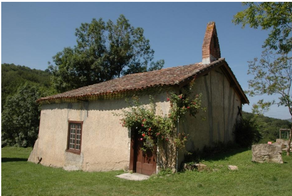
Le temple de Gabre

Le temple actuel de Gabre a été construit il y a deux cents ans, mais pour bien comprendre son histoire il faut remonter bien plus haut.