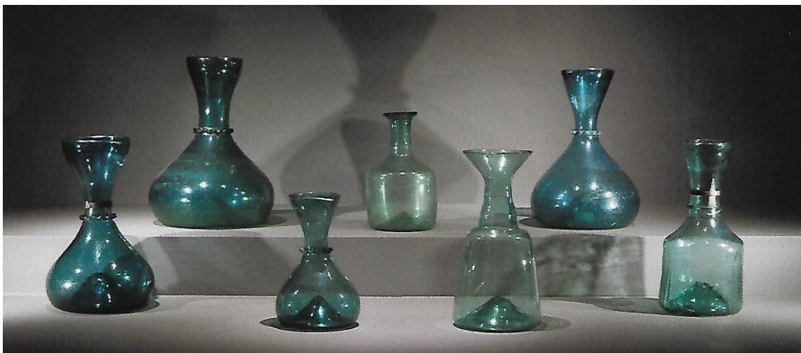
Mesures , XVII-XVIII ème s. (provenances et collections diverses)