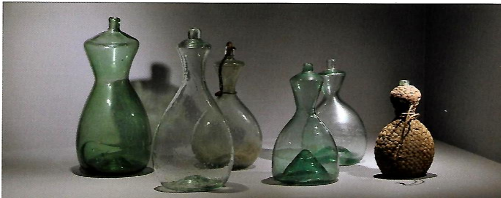
Bouteilles de berger, XVIII et XIX ème siècles, Languedoc, Verreries de Moussans, Musée de Sorèze et collections particulières