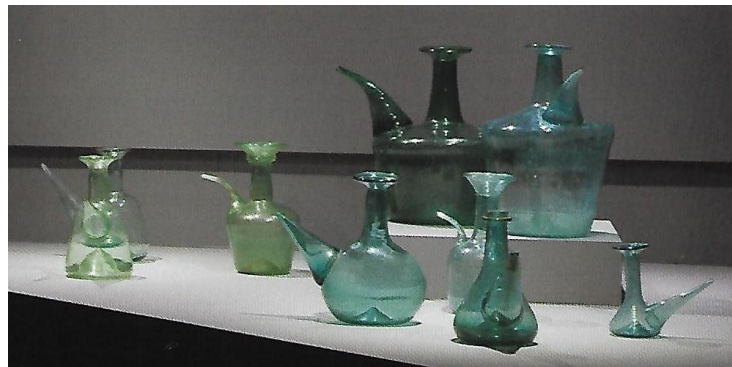
Ensemble de porrons, XVIIème au XIXème siècle, Montagne Noire, Catalogne, Verreries de Moussans (Musée de Sorèze, Musée Raymond Lafage, collections particulières)