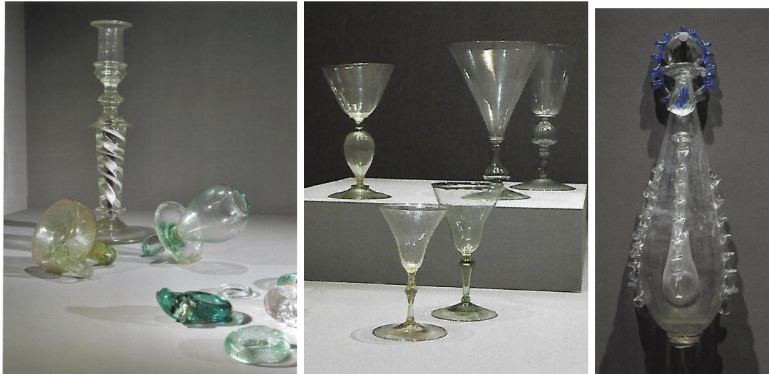
A gauche : Chandelier , 1780-1820, verreries de Moussans (Coll. Musée du verre de Sorèze) ; 2 Veilleuses sans piètement , XVIII ème s., verreries de Moussans (Coll. particulière) ; anneaux (harnachement, tisserand) XVIII-XIX ème s., verreries de Moussans (Coll. particulière).

« Viennent enfin les objets les plus luxueux, sophistiqués, bijoux splendides réservés aux catégories plus aisées ou à usage religieux ... Veilleuses à huile, verre à vitre, anneaux (de tisserand ou pour le harnachement des chevaux), tonnelets, objets à fort potentiel symbolique... »