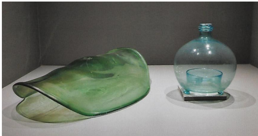
Tuile , XIX ème , Languedoc, et Gobe-Mouche XIX ème siècle, Verreries de Moussans (Coll. particulière).