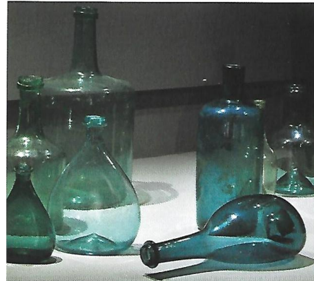
A gauche : Grande bouteille réniforme (XVIII ème siècle), Cloche de Table (XVII ème siècle), Porrone (XVIII ème siècle), Grésigne, Montagne Noire, (Collections particulières).