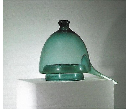
A gauche : Urinal (XVIII e , forêt de Grésigne, Musée Raymond Lafage), et Topettes (XVIII e et XIX siècles, Verreries de Moussans et Sud-Ouest, Musée du verre de Sorèze et Coll. particulière).