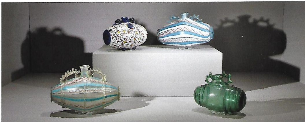
Ensemble de tonnelets, XVII ème ou XVIII ème s.

A droite : baromètre à eau (ou bouteille à tonnerre), XVIII ème s., 29cm, (Coll. particulière).