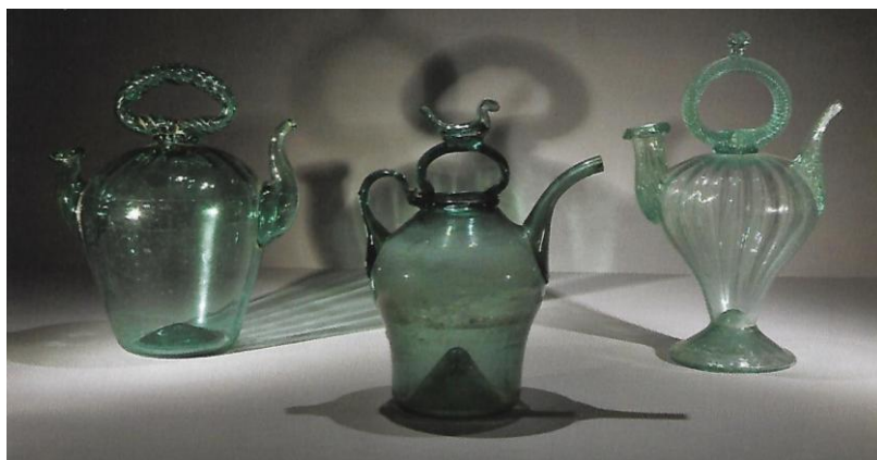
De g. à d. : Cantir , XIX ème , Languedoc (Coll. particulière). Cantir ou Cruche à eau bénite XVII-XVIII ème s., 20cm, Grésigne (Musée Toulouse-Lautrec). Cantir ou Cruche à eau bénite XVIII ème s., 27,5 cm, Montagne Noire (Coll. particulière).