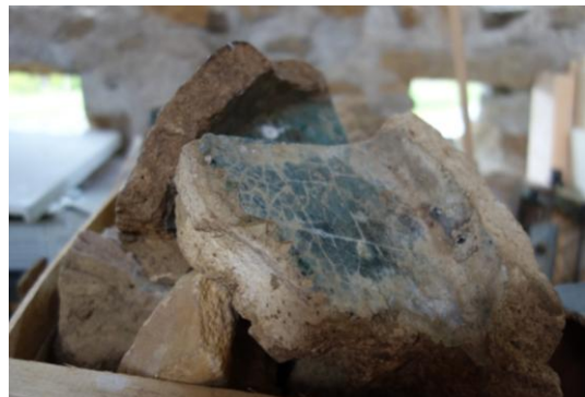
Morceaux de creusets trouvés à Lafitte

A suivre : le hameau d'après le cadastre de 1828 ; la maison des verriers ; les vestiges trouvés sur le site ; le déclin de la verrerie.