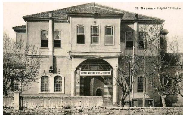
L'hôpital militaire de Damas « Henri de Verbizier »

Les années passaient lorsque l'on apprit qu'une cérémonie importante se préparait. En 2000, comme le veut la tradition les élèves de l'Ecole du Service de Santé des Armées à Lyon Bron furent appelés, pour le baptême de leur promotion à élire leur propre parrain.