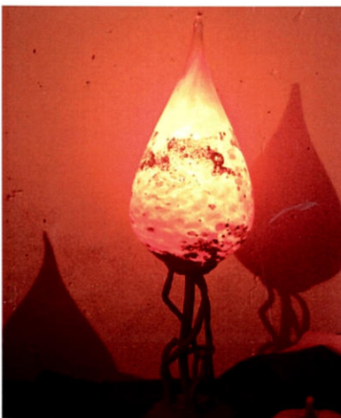
Lampe goutte sur ferronnerie