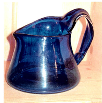
Pichet d'un seul tenant

« Ce qui m'a toujours intéressé dans le verre soufflé, c'est la part de rêve, de magique suscité par la transformation de la matière en fusion en un objet dont les couleurs sont magnifiées par la transparence du matériau. Il y a dans le travail du verre une part de sculpture puisqu'en le caressant on donne au verre des formes, galbes rondeurs »